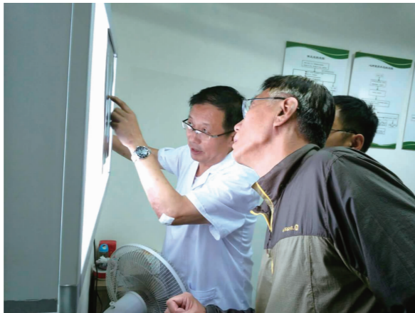
认真看片，查找病因

与此同时，医院在六楼多功能厅举办了多场高水平的中医讲座。全国政协常委、农工民主党中央副主席、长春中医药大学终身教授阎洪臣先生，首批全国名老中